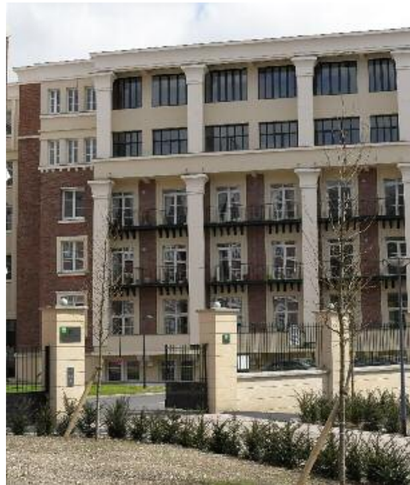
L'ilot Bon Secours à Arras est une réalisation concertée entre l'office HLM, Pas-de-Calais Habitat, le Conseil Général, la Mairie et les associations.