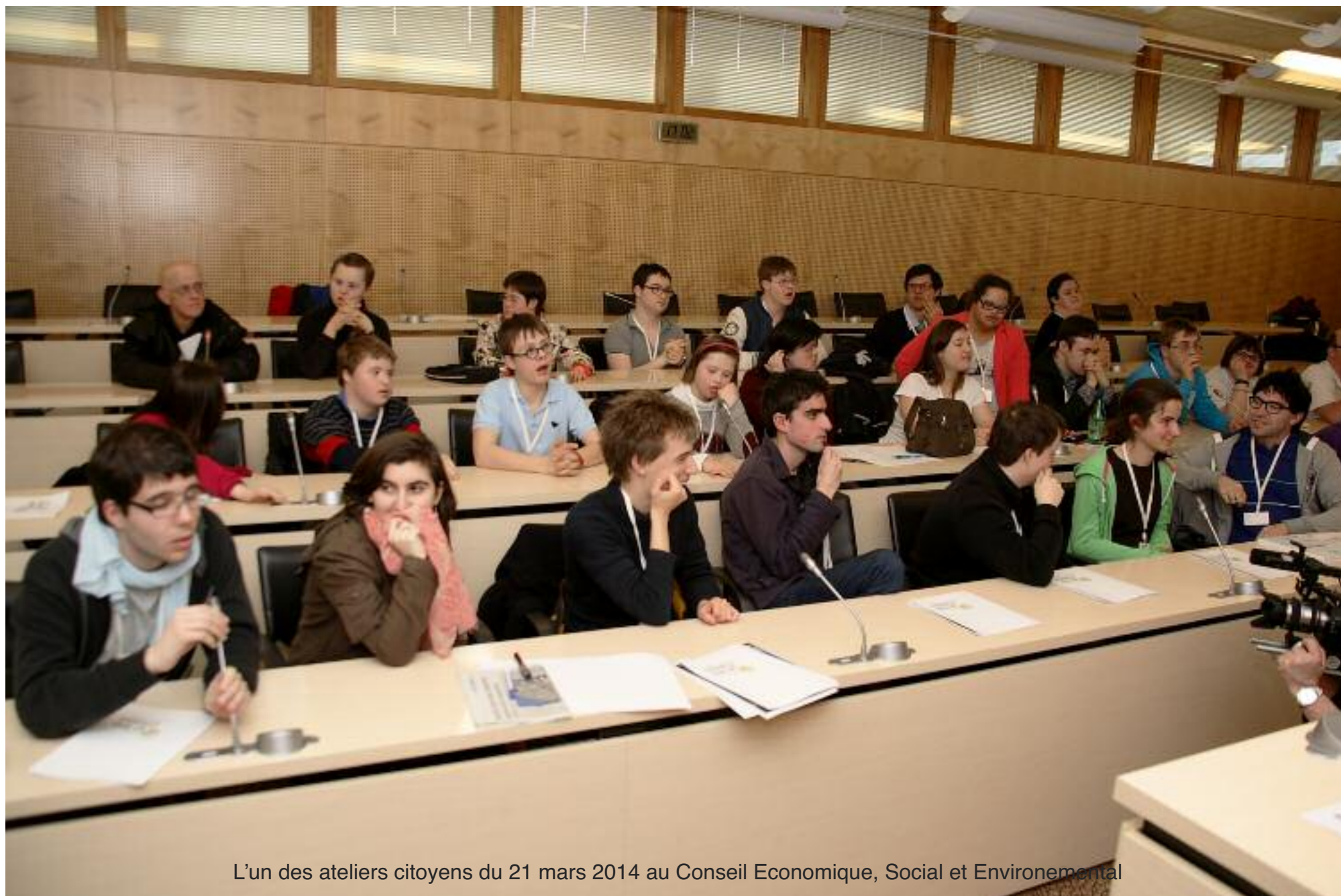
L'un des ateliers citoyens du 21 mars 2014 au Conseil Economique, Social et Environnemental